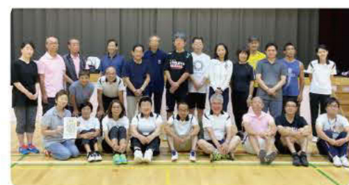
コムスポ審判研修会 2019