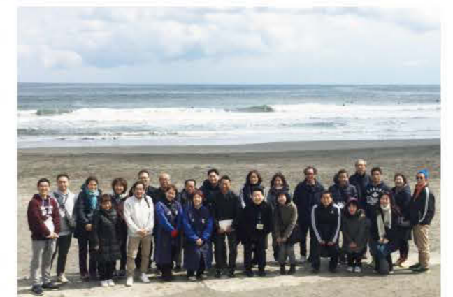
1DAY研修 (サーフィン会場見学)