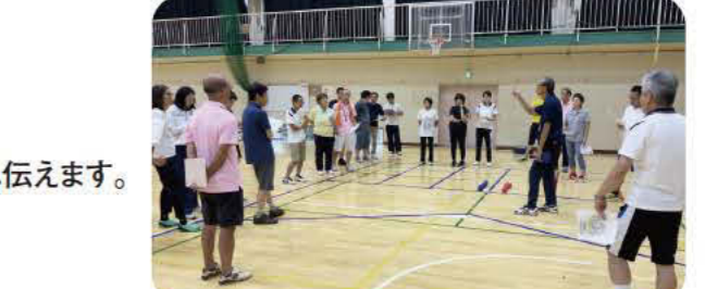
コムスポ審判研修 (ボッチャ)