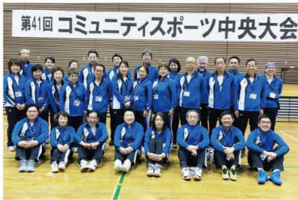
コミュニティスポーツ大会での競技審判