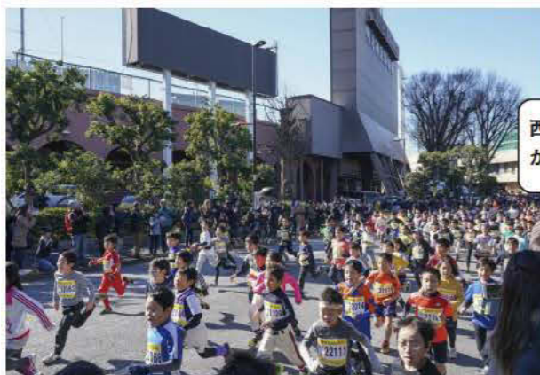
新宿シティハーフマラソンの沿道ボランティア