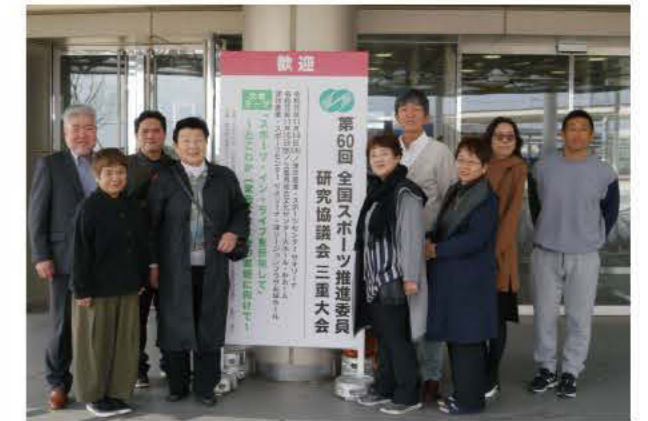
全国大会等への出席