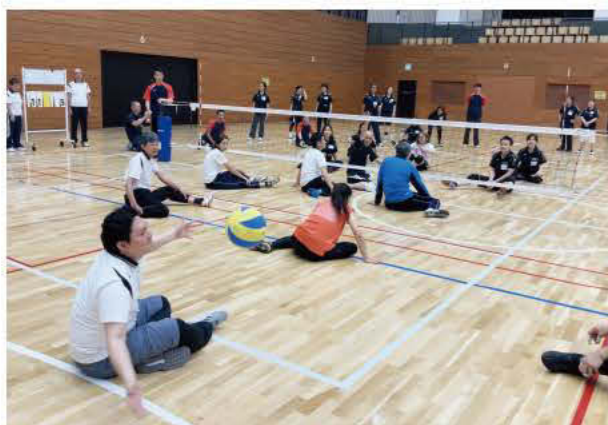
第一ブロック研修会 (シッティングバレー体験)