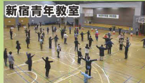
令和3年12月12日、新宿青年教室のスポーツ活動でポッチャ、輪投げ体験のお手伝いをしました。