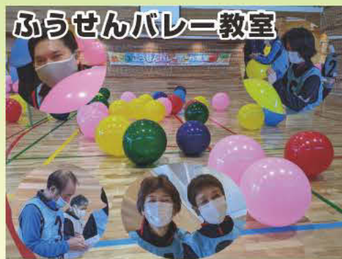
令和3年11月と12月に、都立特別支援学校活用促進事業で、ふうせんバレーボール教室の支援をしました。